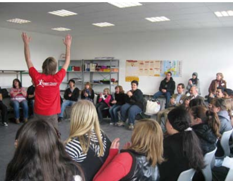
Kreativ Schulkonflikte lösen mit dem Peoples Theater – hier beim Seminar auf der Bildungsmesse

stellten die sozialpädagogischen Fachkräfte ihre Arbeit in Räumen der Heinrich-Böll-Schule (HBS) vor. Rund 150 Jugendliche entspannten sich und spielten dort während der Messe oder nahmen das Angebot zu einem persönlichen Gespräch wahr. Bei den Erwachsenen kamen die Konzepte zur Gewaltpräventionsarbeit an Schulen besonders gut an. Allerdings kamen recht wenige auf einen Besuch vorbei. Die Initiatoren wünschen sich mehr Eltern, Großeltern und Multiplikatoren beim nächsten Mal.